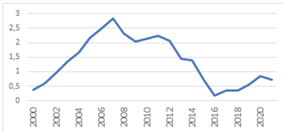
Hectáreas Erradicadas y Asperjadas (t+1) Divididas entre el Total de Hectáreas de Cultivos (t)