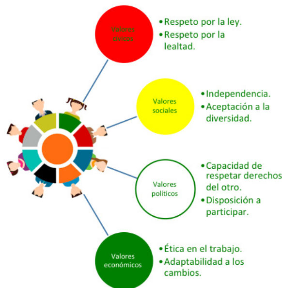
Ilustración 2. Valores democráticos y su relación con otros valores

Esta definición, aunada a la enseñanza de valores democráticos, forma ciudadanos conscientes de su individualidad y del colectivo al cual pertenecen; juntas componen lo que se entiende como “formación cívica”. Tal como se