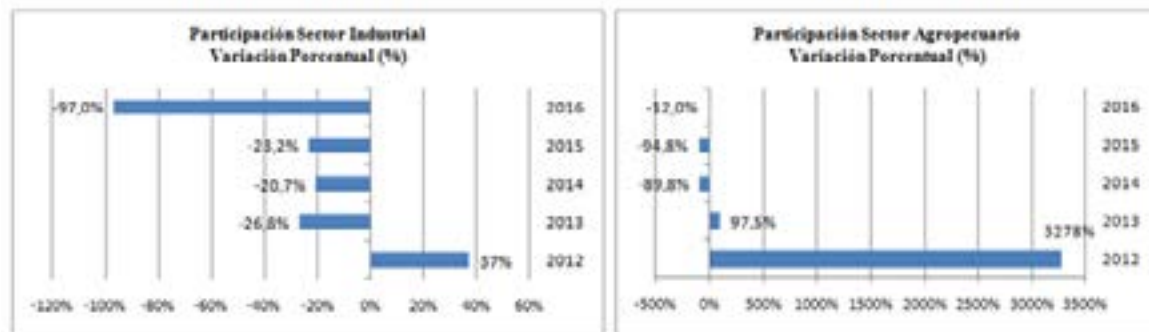
Figura 3. Participación del sector agropecuario y del sector industrial (Variación porcentual)

riodo de estudio. El sector industrial también se vio afectado y mostró una reducción del 60,8% en su participación en el mercado de las exportaciones a lo largo del periodo de estudio.