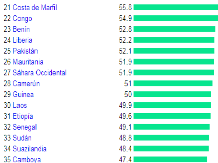
Figura 2. Tasa de Mortalidad Infantil en África periodo 2017. Etiopía