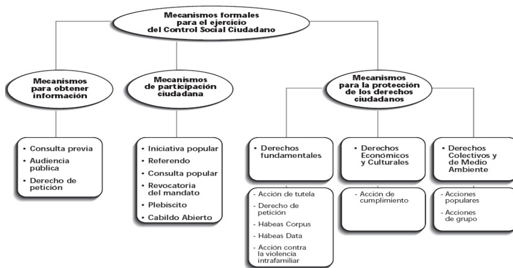
Figura 1. Mecanismos de Control Ciudadano

De esta forma, “el nuevo Estado demanda un nuevo ciudadano y una nueva comunidad donde hayan espacios de concertación y debate colectivo y público que propendan por una adecuada y transparente gestión pública. Labor donde el funcionario público se entiende como un servicio al ciudadano y a la comunidad” (Procuraduría General de la Nación, 2010). De hecho, el programa presidencial Colombia Joven (2005), ha hecho una propuesta metodológica para trabajar los mecanismos de participación y control social y ciudadano (figura 1).