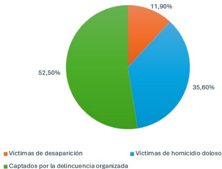
Niñez y adolescencia víctimas de violencia en México 2000 – 2019