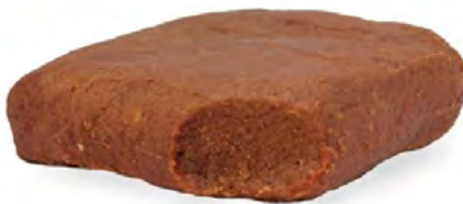
Imagen Nro. 9. Pasta de Dátil

En Colombia la pasta de dátil se utiliza para hacer postres, tortas con dátil y nueces, en brownies y pan con dátiles.