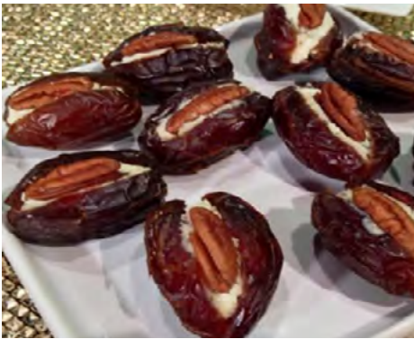
Imagen Nro. 6. Dátil con nuez y coco rallado.

En la actualidad podemos encontrar este delicioso fruto en múltiples preparaciones, ya sean en postres, helados, en las granolas o en las ensaladas. Otra forma de disfrutar este delicioso fruto, es en unas “tapas”, envueltos en tocineta o rellenándolos de nueces y coco