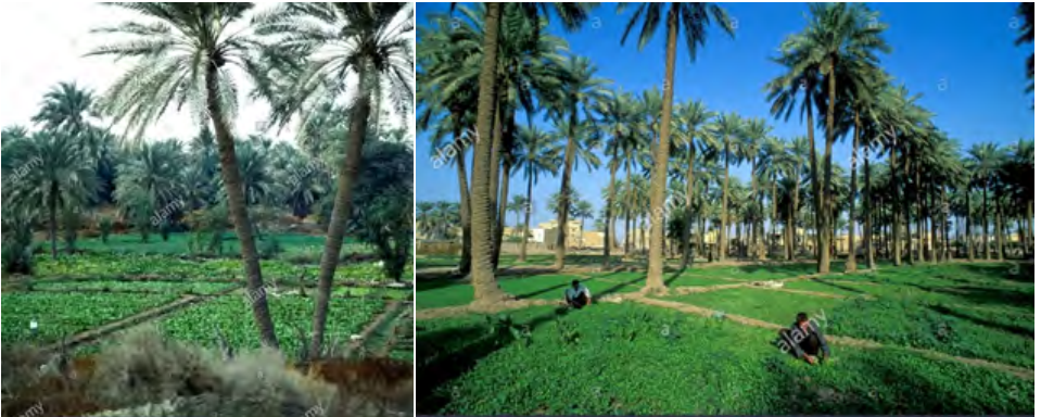
Imagen Nro.4.y 5 En la parte de abajo, cultivo de hortalizas protegido con las ramas de las palmas de dátil.

palmas datileras, los (tomates, fresas, sandía, garbanzos, etc.)