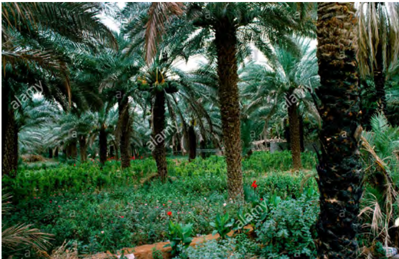
Imagen Nro.3. En la parte de abajo, cultivo de hortalizas protegido de las ramas de las palmas de dátiles.

Kadrawi, Khinezi, Ajwa, Mabroom, Sukkary, Safawi, Mozafati, Zahidi, etc). Además, de cultivarse en países del Medio Oriente, los dátiles también, se cultiva en algunos países de América.