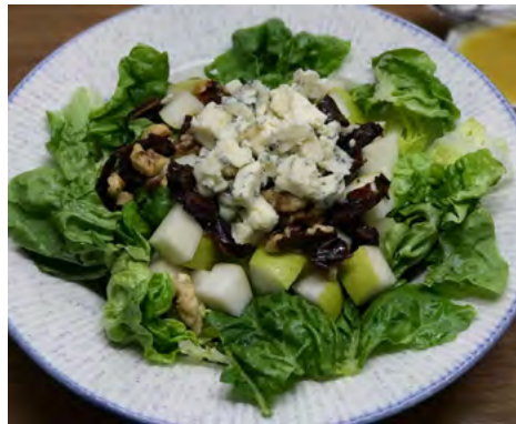
Imagen Nro. 7. Ensalada de Pera, Dátiles, Frutos Secos y Queso Azul

rallado. También se puede preparar mermeladas de dátil o vinagreta de dátil. ¡Ah! y que decir si los utilizas en pizzas, con queso, manzana y dátiles; o pizzas de prosciutto con dátil; un verdadero manjar.