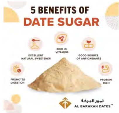
Imagen Nro. 8. Azúcar de Dátil

las bondades y riquezas del dátil, puedo seguir nombrando muchas otras formas de preparación que pueden sorprenderlos, como la Pasta de Dátil, utilizada para preparar el Maamoul (galleta típica de países árabes consistente en un exterior polvoroso y relleno con este delicioso fruto seco); también para hacer