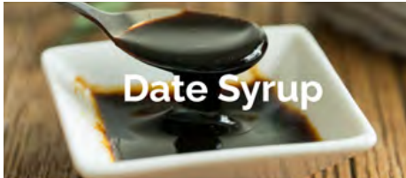
Imagen Nro. 7. Syrup de Dátil.