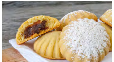
Imagen Nro 10. Maamoul