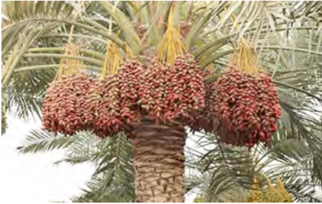
Imagen Nro. 1 . Cultivos de Datil.