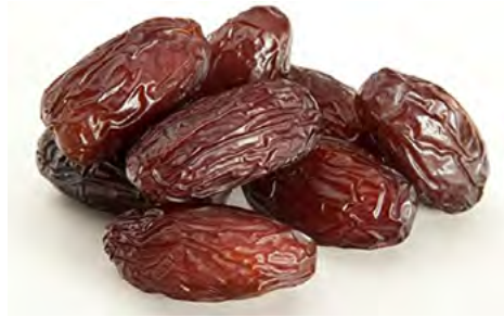
Imagen Nro. 2. Datil Medjool.

Otra de las curiosidades de este fruto natural, es que dependiendo del país o región se le puede reconocer con diferentes nombres, por ejemplo; Khalas, Medjool, Deglet Nour, Barhi, Sayer, Dabbas, Fard, Khundri,