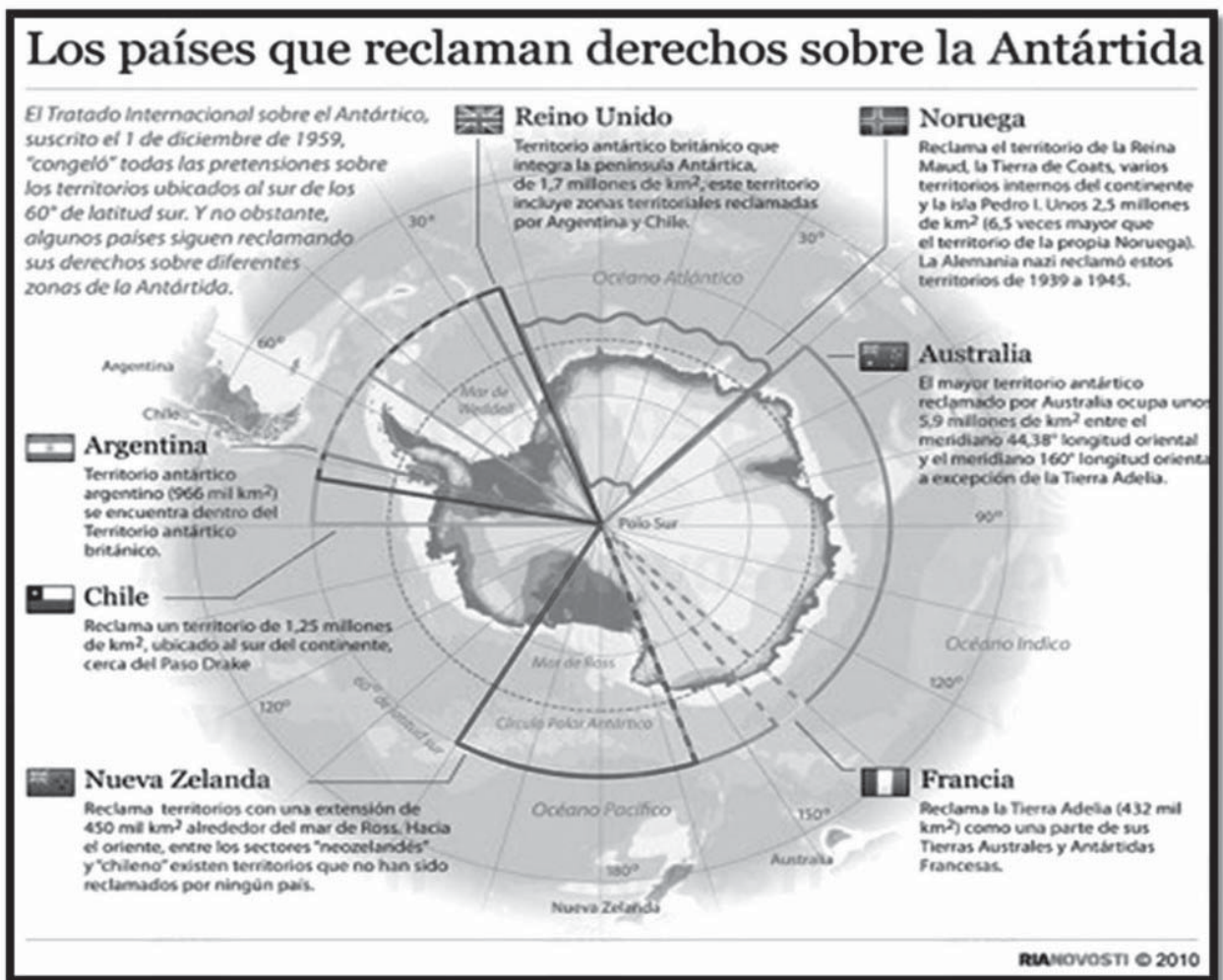
Imagen No. 2: Reclamación jurídica sobre la Antártida. 4

fronteras y su importancia? ¿Por qué es importante la isla de Malpelo? ¿Es solamente por el mar territorial, la zona económica exclusiva o su proyección en la Antártida? Después de tantos interrogantes, nos resta preguntarnos: ¿Qué hacer?