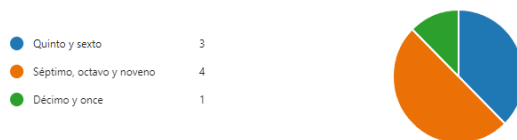
Figura 3. Encuesta de problemática escolar.