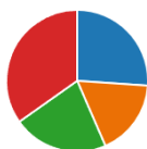
Figura 4. Encuesta de problemática escolar

Pues bien, aquí en esta figura se presenta que el 100% de docentes encuentran presencia de agresiones verbales, 75% observan agresiones físicas, 62,5% aducen la presencia de manifestaciones de ira en sus encuentros de clase y 50% han percibido hostilidad en sus espacios académicos.