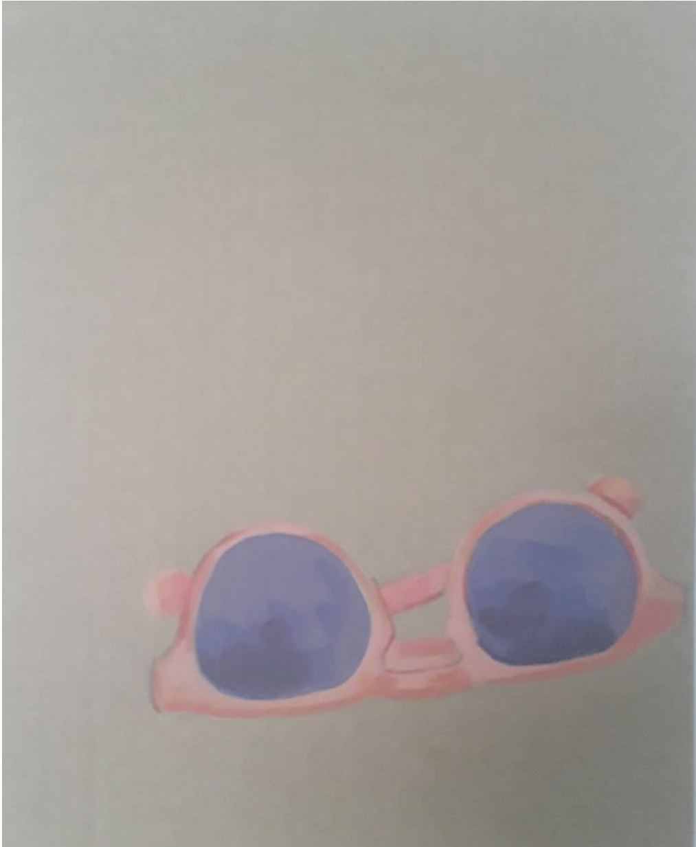
Sin título. Acrílico sobre cartón 27 cm x 17.5 cm. Año 2020