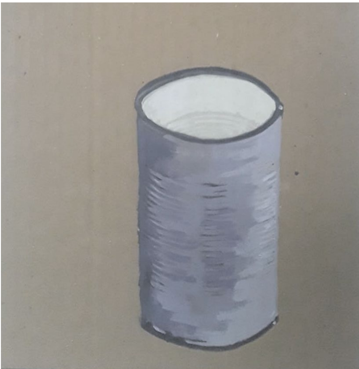
Sin título. Acrílico sobre cartón. 33 cm x 19.5 cm. Año 2020