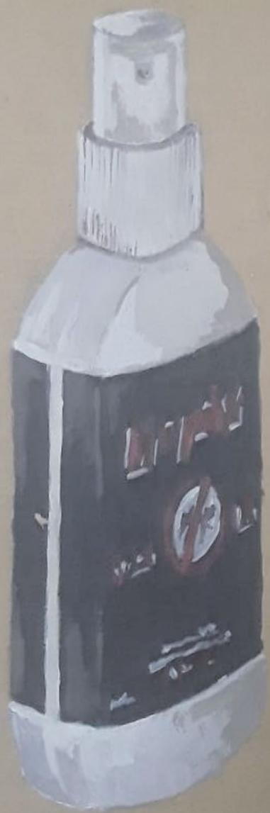
Sin título Técnica: Acrílico sobre cartón 18 cm x 30 cm. Año 2020