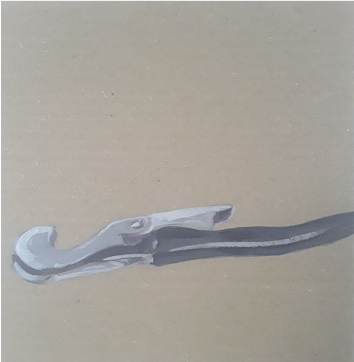
Sin título. Acrílico sobre cartón 18 cm x 24 cm. Año 2020