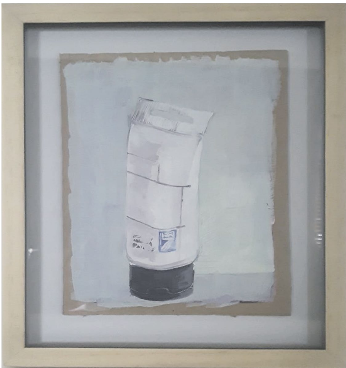
Sin Título. Pintura acrílica sobre cartón 15 cm x 22cm. Año 2020