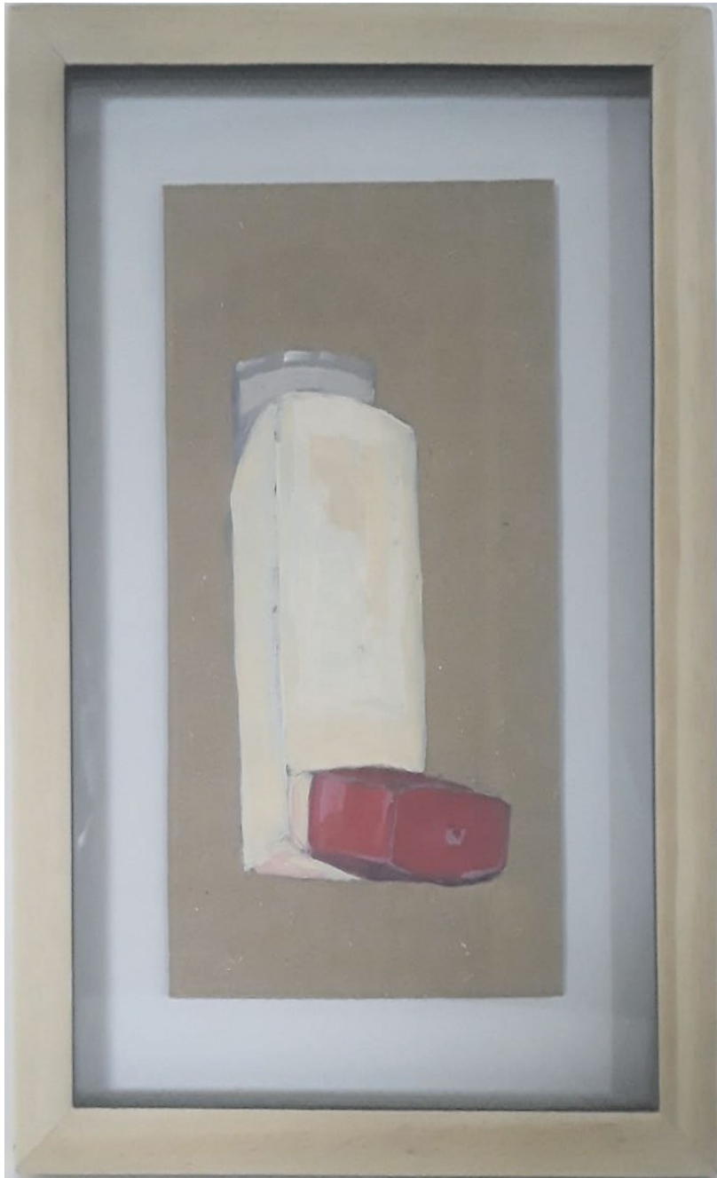
Sin título. Técnica: Pintura acrílica sobre cartón. 10 cm x 19 cm. Año 2020