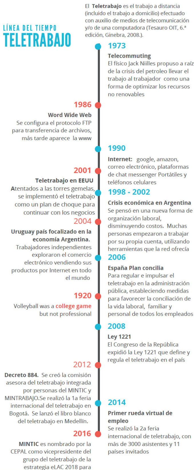
Figura 1. Historia del teletrabajo. 1