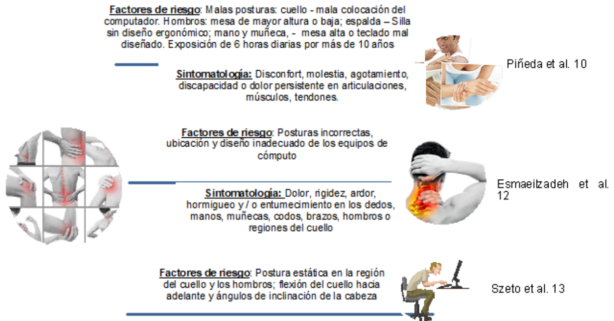
Figura 2. Trastornos musculo esqueléticos