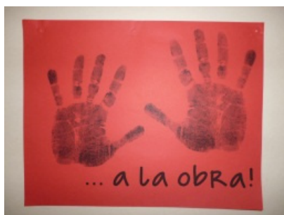
FIGURA 2. Campaña de expectativa ubicada en las áreas

La fase de Hacer del ciclo PHVA, inició con una campaña de expectativa con afiches publicados en las carteleras durante 8 días (ver Figura 2). Después se realizó lanzamiento del programa a los jefes de las áreas para que lideraran la participación de sus colaboradores en las formaciones sobre cuidado de las manos y se realizaron talleres de sensibilización que incluyeron actividades de amarrado de zapatos de cordón con una sola mano, escribir con la mano no dominante el nombre, abotonar o colocar la camisa sin ayuda de las manos, identificar figuras y texturas con las manos y con un los ojos cubiertos.