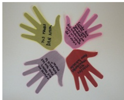
FIGURA 3. Figuras de manos con mensajes alusivos a su cuidado escritas por los trabajadores.

Una vez realizada la formación sobre los aspectos a tener en cuenta para cuidar esta parte del cuerpo en la realización de todas las actividades diarias, se indicó a los trabajadores que plasmaran su mensaje de compromiso frente al cuidado de las manos (ver Figura 3). Los mensajes en figuras de manos recortadas en papel de colores construyeron un árbol de manos que se ubicó en las áreas durante el tercer trimestre del año.