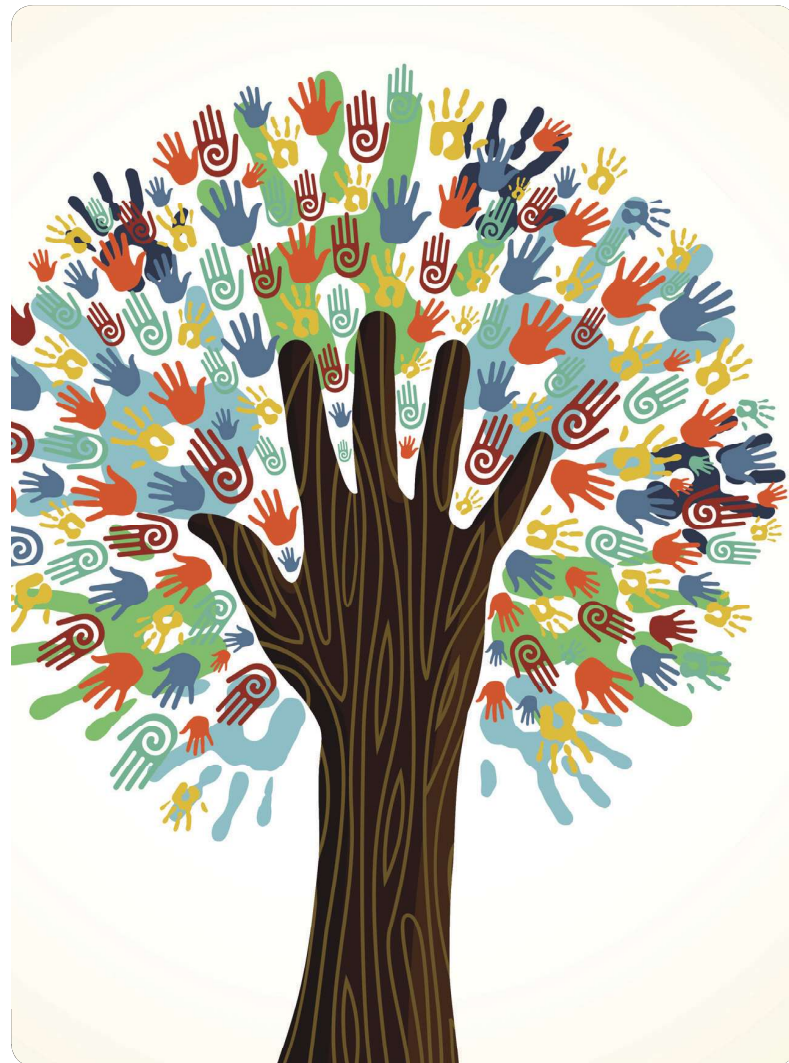
Figura 2: Asociación Colombiana de Cooperativas - Extraído de la página web de la IAF Colombia. 4 Extraído de los informes contenidos por la Fundación en su página web.

Administración de Empresas Universidad Libre. Correos: trujillo-anyik.perdomot@unilibrebog.edu.co dianal.ayalag@unilibrebog.edu.co luisaf.paezg@unilibrebog.edu.co osca-ra.bermudezd@unilibrebog.edu.co victorj.vivasu@unilibrebog.edu.co