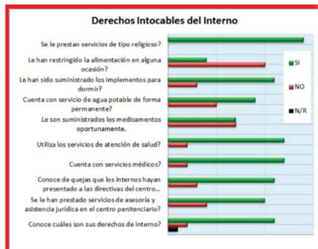
Figura 02: Derechos fundamentales de los internos 3

El centro penitenciario está a cargo del INPEC,