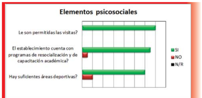
Figura 05: Factores psicosociales referentes

Hay respeto por los derechos fundamentales de los internos.