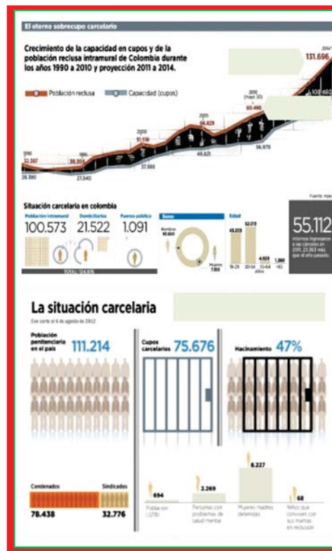
Figura 01: Situación carcelaria – Agosto 2012