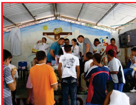
Imagen 06: Celebración de la Eucaristía

Como profesionales del Derecho, consideramos que valdría la pena realizar un estudio sociológico en toda la población colombiana que lleve a determinar que está generando en la población la tendencia al crimen. Siempre se habla de realizar un Conpes, como en efecto se realizó para los jóvenes y adolescentes y se crea el Sistema de Responsabilidad para el Adolescente, que en términos coloquiales, se pretendió penalizar a la población entre 14 y 18 años, como jóvenes que en ese momento hacían parte de las pandillas y la delincuencia