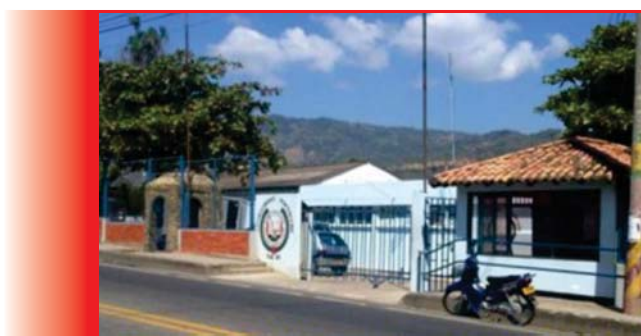
Figura 1. Cárcel de Mediana Seguridad San Gil