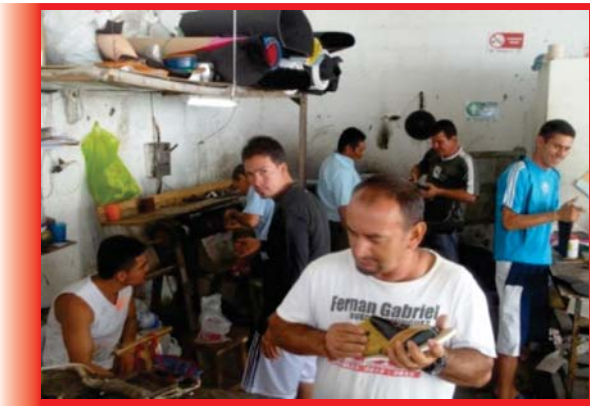
Imagen 04: Internos de San Gil en los talleres del centro penitenciario