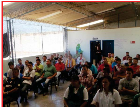
Imagen 03: Los internos de San Gil recibiendo Formación Pedagógica.

Vargas (2010) vi , en su documento expresa: ...(...) El Código Penal que rige en la actualidad en Colombia, establece las funciones de la pena de la siguiente manera: " Artículo 4. Funciones de la pena. La pena Cumplirá las funciones de prevención general, retribución justa, prevención especial, reinserción social y protección al condenado. La prevención especial y la reinserción social operan en el momento de la ejecución de la pena de prisión " [20,21]. Por otra parte, el Código Penitenciario y Carcelario, Ley 65 de 1993, señala las Funciones de la pena en el Artículo 9: " Funciones y finalidades de la pena y la medida de seguridad. La pena tiene función protectora y preventiva, pero su fin fundamental es la resocialización. " Se concluye de lo anterior que la pena en Colombia no solo va dirigida a la reparación del daño causado por el delincuente, sino también a la prevención de su ocurrencia, a la protección del condenado, que por ende generará la protección a la sociedad, y a la resocialización de este último para que pueda volver a pertenecer a la sociedad.