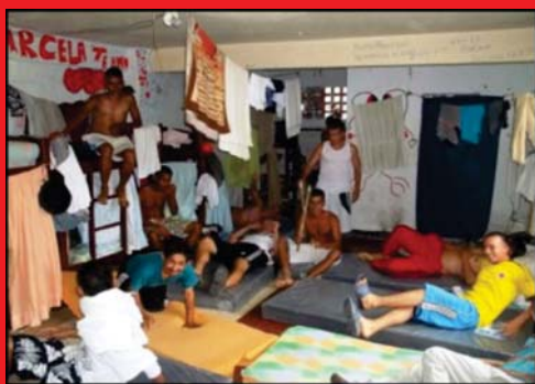
Imagen 02: Problemas de hacinamiento en el Centro penitenciario de San Gil.

El número de presos crece cada año, y su crecimiento es tan rápido que las construcciones de las nuevas cárceles se quedan cortas.