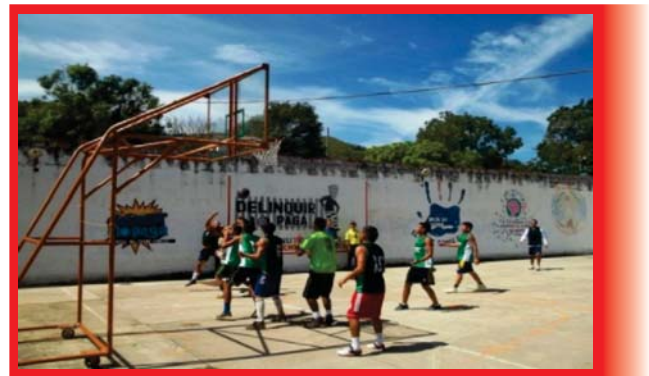
Imagen 05: Recreación en el centro penitenciario de San Gil.

Afectación de los derechos fundamentales de los internos: hacinamiento carcelario en el país, caso municipio San Gil