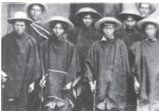
El Cauca Indígena

Son construcciones sociales de vida propia, de una manera nómada, desde el avance científico, que poco a poco se han ido convirtiendo en sedentarios contra su voluntad, por las circunstancias del entorno anotadas en el presente silabario.