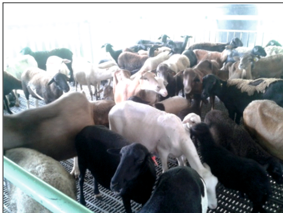
Figura 1. Apriscos en Santander

índice de decrecimiento, de la misma forma en que el consumo per cápita es muy bajo por temporadas; a nivel mundial, excepto los países de gran potencia en producción, los índices se mantienen constantes al igual que el consumo, siendo una de las mejores líneas de proteína. Como conclusión, el gran mercado mundial que existe de los productos ovinos y caprinos en Colombia, se encuentra limitado con respecto a muchos países productores, debido a la poca producción programada e industrializada en el país; estos retos no se pueden alcanzar a causa de la falta de información del Estado y de los productores, generando que la inversión estatal sea muy limitada.