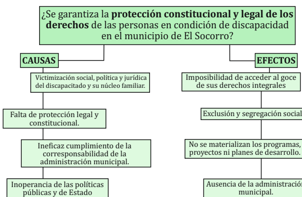
Figura 1. Descripción del problema, causas y efectos

La condición de discapacidad es una problemática social poco mencionada pero que en la mayoría de los casos afecta a la población socio-económica más vulnerable, esta situación es la que ha motivado la creación de este proyecto que busca conocer no solo las diferentes necesidades de las personas con discapacidades, sino a su vez utilizar las diferentes normatividades que buscan la protección de estas personas menos favorecidas.