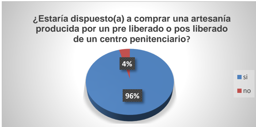
Figura 2: Disposición de comprar una artesanía elaborada por un preliberado

El 96% de los encuestados afirma que estaría dispuesto a comprar una artesanía producida por un pre liberado o pos liberado de un centro penitenciario mientras un 4% dice que no estaría de acuerdo