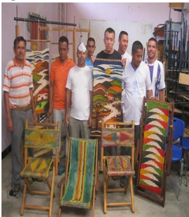
Figura 1: Artesanos INPEC San Gil

Este documento presenta el estudio realizado para determinar, evaluar y proponer una figura jurídico-administrativa que permita definir la forma empresarial más efectiva para la producción y comercialización de los productos elaborados por el pre liberado del Centro Penitenciario de San Gil, y que pueda servir como modelo para el Instituto Nacional Penitenciario y Carcelario de Colombia (INPEC) a nivel nacional, se ha realizado un comparativo y encuestas entre las diferentes modalidades de figuras jurídicas como S.A.S, cooperativa y fundación, definiendo ventajas y desventajas de cada una como beneficios en la parte tributaria y otros , dando como resultado que la figura idónea para este segmento de población es la fundación por su forma constitución y beneficios que se tienen al ponerla en funcionamiento, de igual manera se planteó la propuesta administrativa, en cuanto a misión, visión, estructura organizacional, valores, estrategias de mercadeo, fundamentado en otra parte importante como es el resultado del estudio realizado a través de encuestas dirigidas a la población hotelera, centros comerciales, tiendas