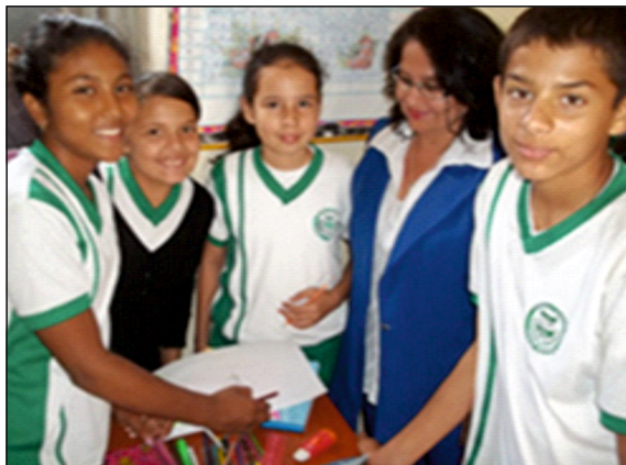
Figura 1. Estudiantes en desarrollo de actividades de prevención de la violencia escolar

que desarrolla una aproximación y una construcción de conocimiento con fundamento en conceptos Para el desarrollo de los objetivos planteados se trabajó con el método inductivo partiendo de la conducta del menor de edad para llegar aspectos generales, se clasificó la información, se tabuló y se revisó frente al ordenamiento penal colombiano y la ley de infancia y adolescencia.