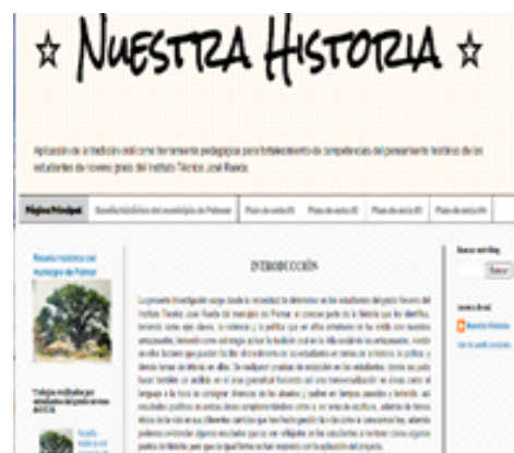
Figura 1 Portada del Blog sobre el fortalecimiento del pensamiento histórico.

Palabras clave antepasados, historia, oral, social, tradición.