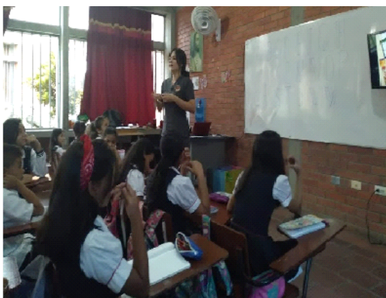
Figura 1. Ambientación al tema tipos de textos.

partir de ello se implementó una secuencia didáctica. Esta estrategia metodológica fundamentada en la investigación acción educativa se orientó desde su inicio, en el propósito del texto; y cautivar la atención del estudiante hacia la expresión escrita de un cuento desde