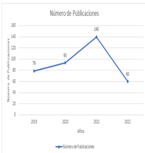
Figura 1. Número de publicaciones por año.

En el proceso comparativo se consideraron los años 2019 como punto previo al surgimiento del Covid-19; 2020 como año de surgimiento del virus; 2021 como año de continuidad a los procesos comportamentales iniciados en 2020 a causa de la pandemia y 2022 como referente de fecha actual, durante la cual se llevó a cabo el proceso de investigación para el presente documento.