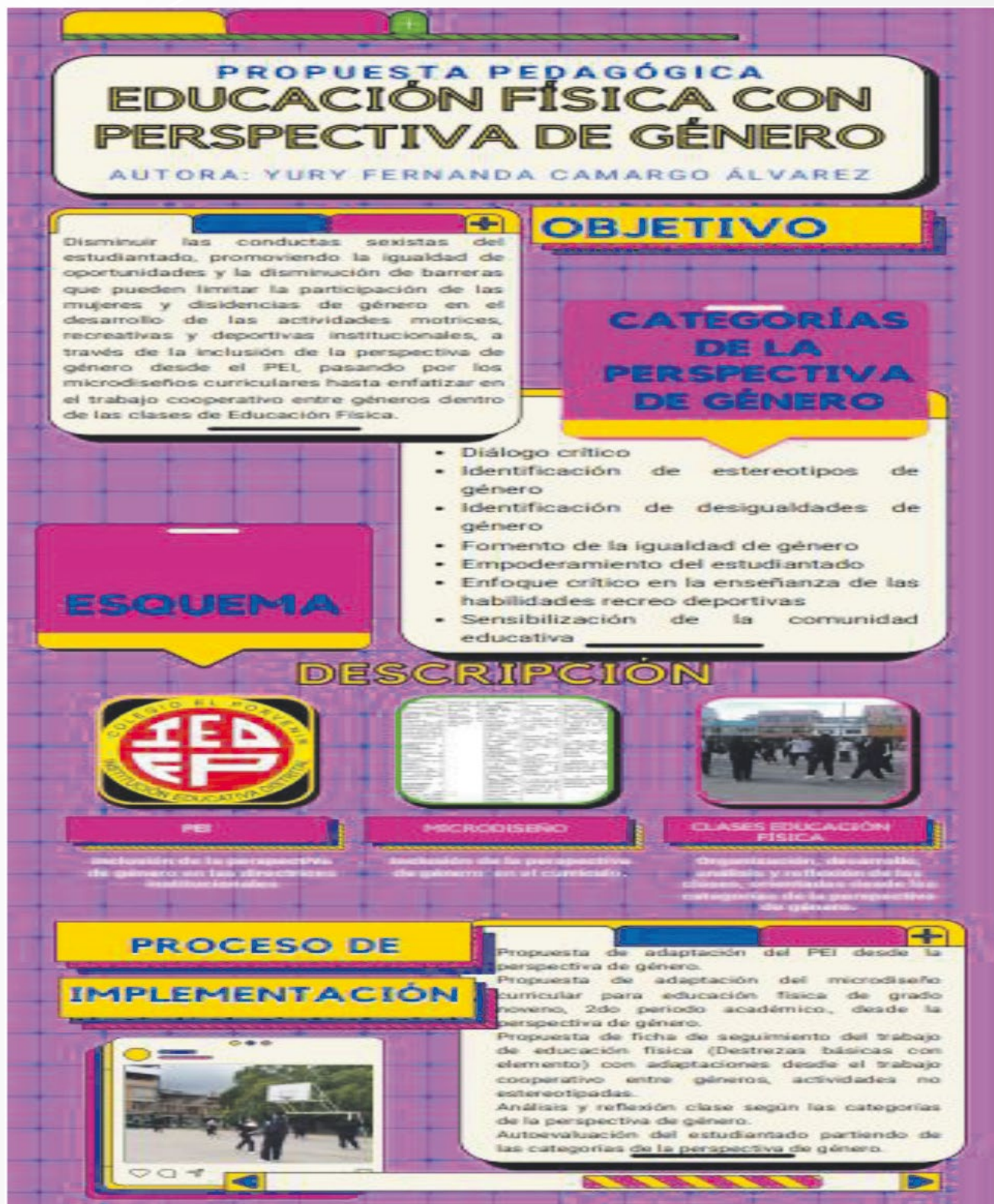
Figura 3 Propuesta pedagógica de educación física con perspectiva de género.