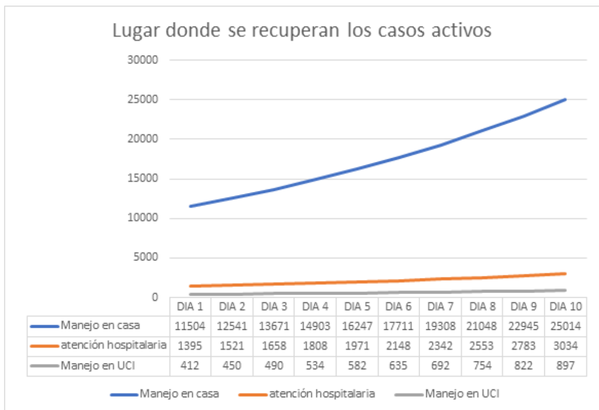
Figura 3. Lugar donde se recuperarían los casos activos

NRB: número reproductivo básico Dia de epidemia: 67