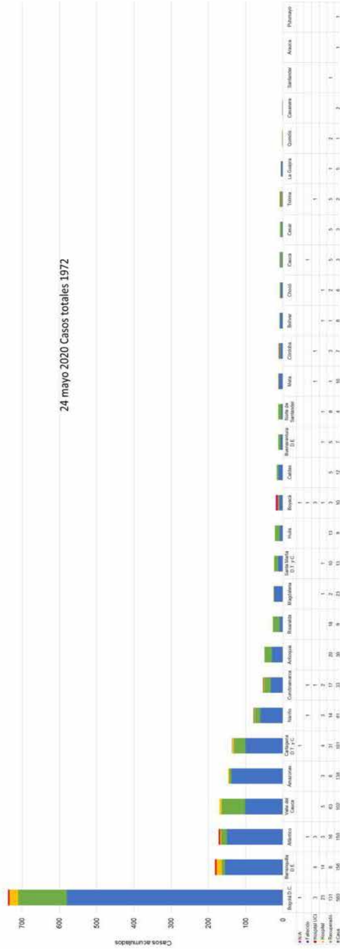
Figura 1. COVID-19: Colombia, pediatría <18 años, Información por departamento, datos extraídos del Instituto Nacional de Salud de Colombia (12).