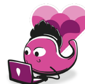
Amigos y pares