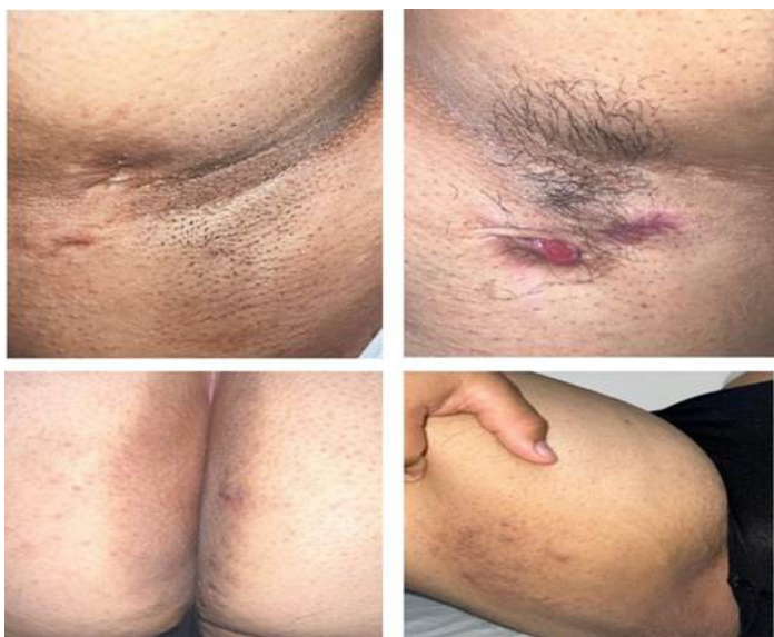
Figura 10. Hidradenitis suppurativa. Se evidencia un paciente que presenta en regiones axilar, interglútea e inguinal cicatrices depirimidadas y pigmentadas, abscesos, nódulos eritematosos y comedones.

A continuación, se describen las principales manifestaciones cutáneas de los trastornos tiroideos.