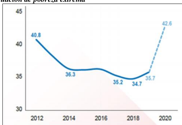
Figura 2. Personas en situación de pobreza extrema