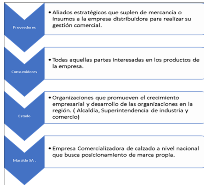
Figura 3. Actores