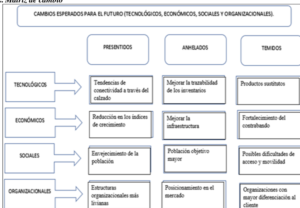
Figura 2. Matriz de cambio

La segunda herramienta para aplicar es la matriz de cambio con la cual se busca identificar los cambios esperados, anhelados y temidos de la organización en el futuro. Se procede a preguntar a cada uno de los expertos en los diferentes ítems cuales son los cambios que presienten, anhelan o temen (figura 2). De acuerdo con la información obtenida se identifican las tendencias de la siguiente manera: tecnológica, económica, social y organizativa.