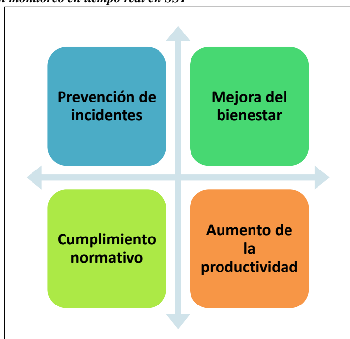
Figura 3. Beneficios del monitoreo en tiempo real en SST

La implementación de sistemas de monitoreo en tiempo real ofrece numerosos beneficios. En la figura 3 se destacan los más relevantes.