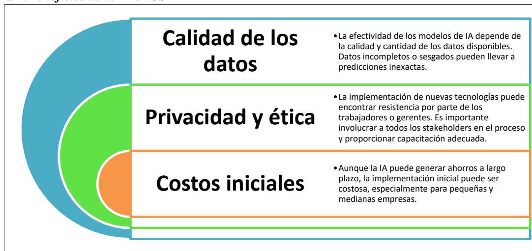
Figura 2. Beneficios de la IA en SST

A pesar de sus beneficios, la prevención predictiva de accidentes laborales mediante IA no está exenta de desafíos. La figura 2 sintetiza los retos esenciales y una breve descripción de los factores a considerar.