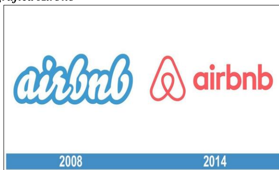
Figura 1. Rediseño de marca gráfica Airbnb

La Identidad Visual de la compañía ha pasado por distintas etapas, aunque siempre con cambios que respetaban los lineamientos. Desde sus comienzos, la identidad adolecía de cierto amateurismo, tal y como explica Andrew Schapiro, director de diseño de Airbnb, el logo “fue creado sin un entendimiento real de lo que Airbnb era realmente” (Faura, 2014) (figura 1). En la Identidad Visual de Airbnb a lo largo de la historia de la empresa, como es visible solo hay un rediseño, realizado en el 2014, cuando el logotipo azul original diseñado en el 2008, se cambió a un estilo gráfico completamente nuevo.