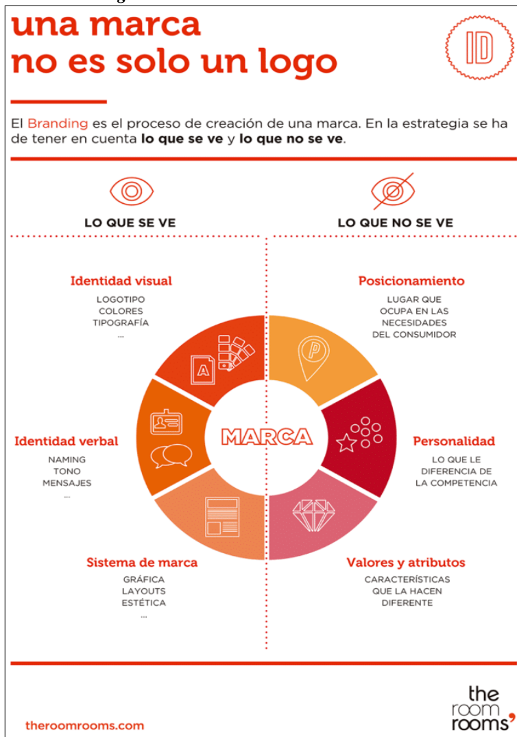
Figura 5. Una marca no es solo un logo

la percepción de la empresa. Diferenciarse y tener una imagen definida es un factor determinante para el crecimiento de una idea de negocio o vida de una empresa. Por dicha razón, es relevante considerar la implementación de una estrategia de Identidad Visual y Branding.