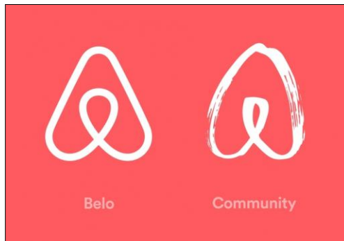
Figura 2. Rediseño de marca gráfica Airbnb

Faura (2014) en sus investigaciones de la renovación de marca Airbnb, relata: Los directivos de la empresa decidieron contratar a la agencia londinense llamada DesignStudio, para ayudar a redefinir el Branding de Airbnb y crear una nueva Identidad Visual perdurable en el paso del tiempo. El objetivo principal marcado para el desarrollo del rediseño fue transformar completamente la identidad para proyectar la nueva situación de la compañía, cada vez más global y en expansión permanente (figura 2).