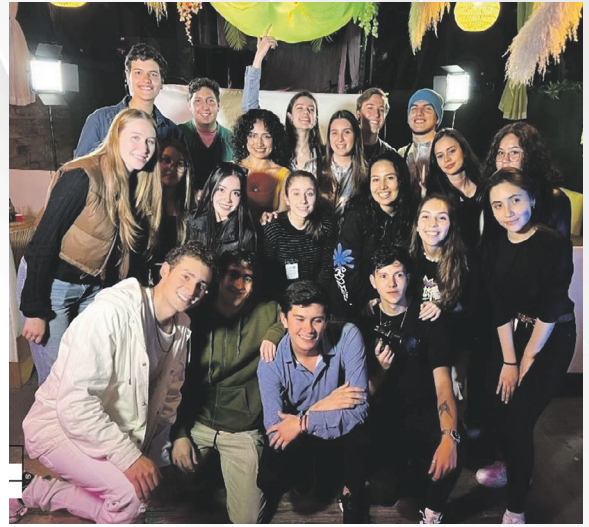
Producción Viaje a Marte 2023.

“Me encuentro agradecida con Sin Mente Teatro por hacerme parte del grupo aun siendo tan joven en muchos sentidos; a Sin Mente no solo lo conforman artistas con una gran trayectoria artística, son seres humanos excepcionalmente generosos, he crecido mucho con ellos tanto en lo artístico como en lo personal. Ser una de las actrices principales de Tomás ha sido un reto gigante hablando desde la técnica escénica; además interpreto a una mujer muy fuerte, sensible y con una realidad muy cruda; aquí contamos la historia que muchos callamos, muy merecedora de ser escuchada. Nadie merece cargar con el peso del silencio, y Tomás rompe con él. Deseo seguir siendo la voz de otros, incluso la mía porque a veces callo. Amo el teatro, el cine, actuar en todas sus presentaciones y en este espacio agradezco a todos quienes han formado parte del corto camino que hasta ahora llevo como artista”.