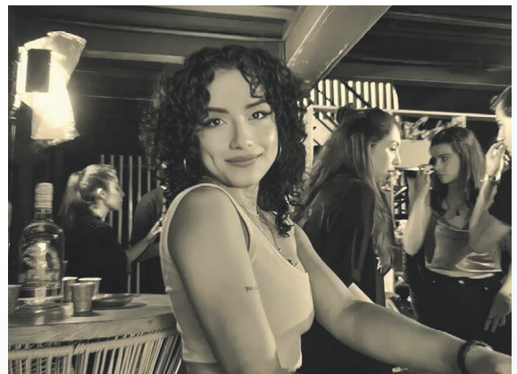
Personaje Laura – Viaje a Marte 2023