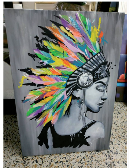
Mulata de fuerza