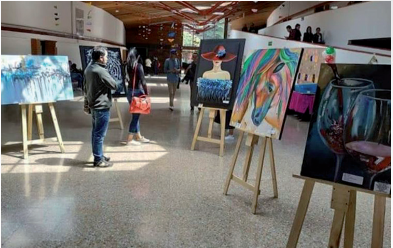
Exposición realizada en el marco del Festival de ARTE y Cultura Lúdica de la Universidad Libre.