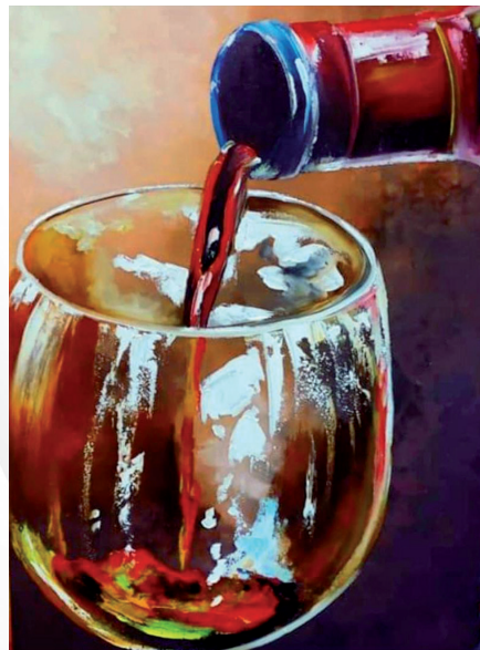
Veladura de ensoñación