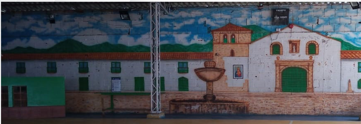
Mural 'Pueblo Villa de Leyva'. Liceo de Ciencia y Cultura Harvard.