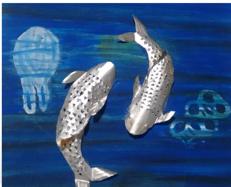
'Metal en el mar.'