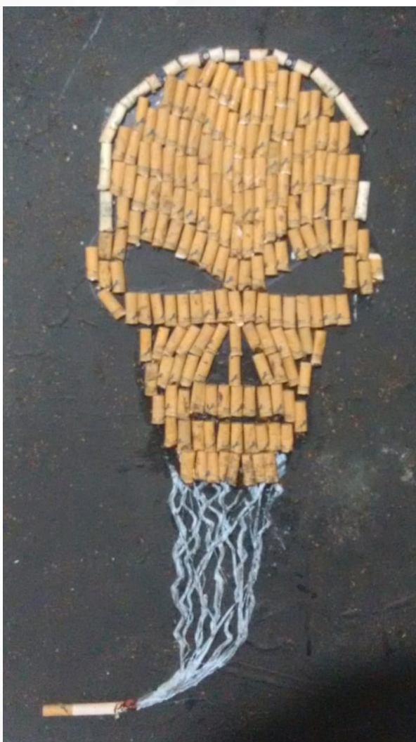
'El cigarro, igual muerte.'