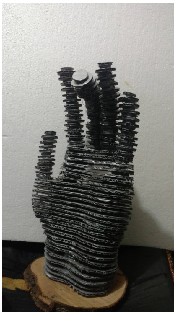
Escultura 'Mano de cartón.'