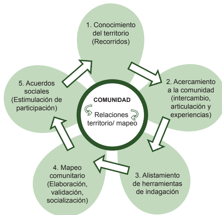
Figura 1. Etapas de la cartografía social para la identificación de activos comunitarios en salud.

La información fue codificada en Atlas.ti 7.0 - licenciado por la Universidad de Caldas—. Para el análisis se exportó una de las nueve categorías obtenidas en el proceso 3 (metodología). La información se ordenó y con la experiencia del trabajo de campo se establecieron las etapas presentadas en la Figura 1.