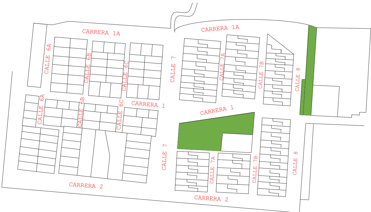
Figura 4. Borrador inicial del mapa de activos de unos de los barrios.