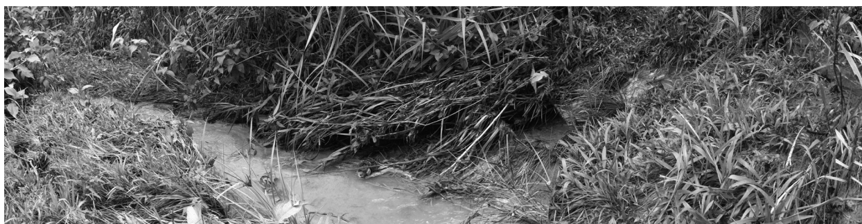
Foto 5. Quebrada del Indio.