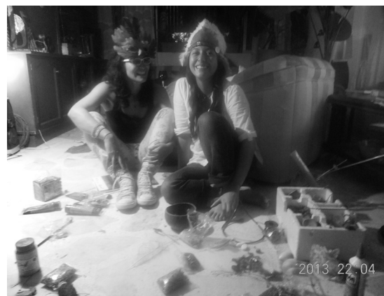
Foto 10. Monitoras en la creación del títere-placenta.