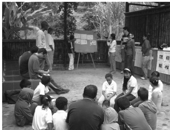
Foto 7. Jornada de trabajo, durante el proceso de lectura de los diarios de campo por parte de los estudiantes del Liceo Campesino Pulgarcito, en uno de los espacios de aprendizaje de la Fundación Social Salud Holística.

Dejarme sorprender cuando al leer en el gabinete o trabajo grupal, mi propio diario de campo, que es mi propio pensamiento, y darme cuenta que aunque pasé por el mismo lugar, el mismo día y a la misma hora con mis compañeros y compañeras, hubo algo que no le di significado a lo que ellos ahora están narrando.