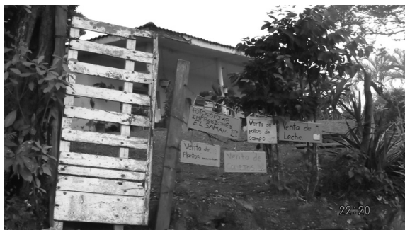
Foto 6. Casa ubicada en la Vereda Alto Los Mangos, con las características descritas, por la monitora Diana Ávila, con lettereros que anuncian los diferentes productos que allí se ofrecen: venta de leche, plantas, conejos, pollos y fotocopiadora.