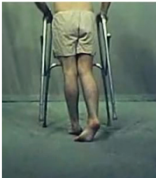
▲ Fig. 2. Marcha en tijeras y empinado