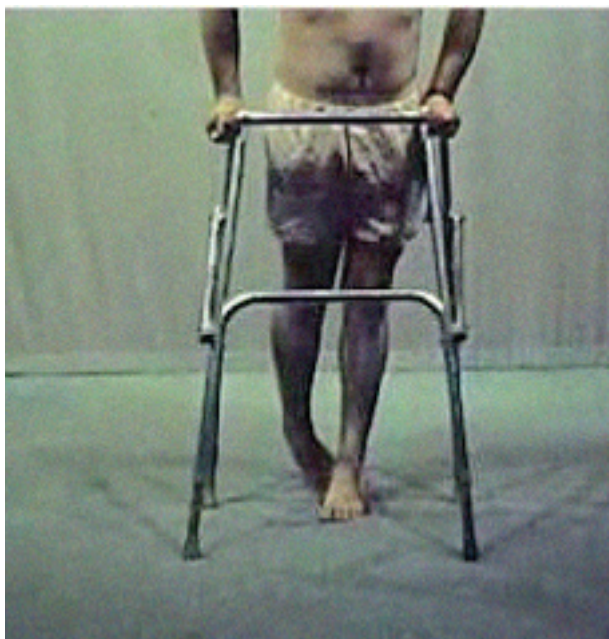
▲ Fig. 1. Marcha en punta de pies