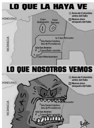
Figura 5. Caricatura sobre el fallo de La Haya

Hemos intentado reconstruir parte del proceso histórico, político y emotivo que ha sido antecedente del actual estado de la disputa territorial por San Andrés e islas aledañas, llamando la atención sobre la forma en que se ha pretendido establecer un dominio social y gubernamental. Hemos buscado proponer una voz que aliente la discusión sobre la