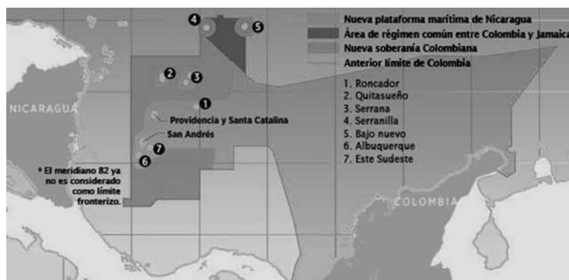
Figura 4. Nuevos límites marinos

Desacatos a normas internacionales, modificaciones tendenciosas de tratados e intervenciones en disputas internacionales, han sido posibles en la medida que los interesados cuentan con un sólido aparatage económico y militar (esto puede ejemplificarse más claramente con el caso de la construcción del canal de Panamá, mencionada secciones atrás). Tales formas de proceder, de los estados poderosos que se atribuyen actos de “justicia”, nos demuestran modos de acción bastante cuestionables que se amparan básicamente en la capacidad de ejercer la fuerza física. Sería “normal” que el mar concedido a Nicaragua termine siendo el marco del desarrollo de proyectos económicos de em-