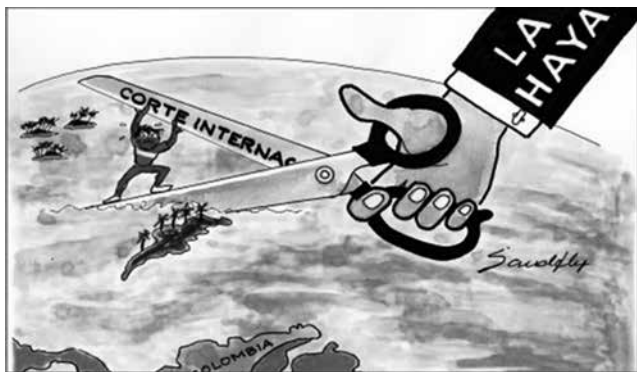
Figura 2. Humor sobre la disputa limítrofe. “Elocuente ilustración de Sandfly, quirúrgica intervención gráfica que describe con afilada apreciación, la persistencia de un pueblo ignorado y empeñado en sobrevivir frente a la arbitrariedad ajena a su realidad...” (Sandfly, 2012).