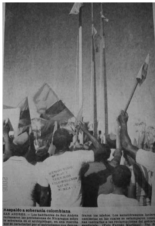
Figura 3. Nacionalismo en la isla.

Este texto alude a valores nacionales asumidos por los isleños, no es claro a qué se refiere teniendo en cuenta que el idioma español y la religión católica causaron fuerte dis-