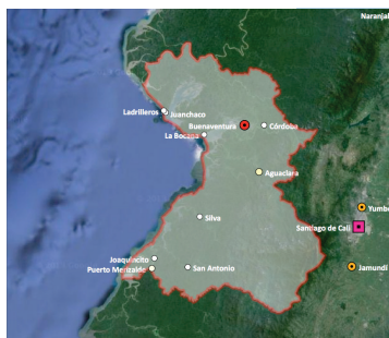
Figura 1. Visión Satélite de Colombia, se observa la ubicación geográfica de Buenaventura en la región Pacífica del país.

En el año de 1986, en la población de Campo Hermoso, se organiza una junta de acción comunal con un inspector y años después crean el Consejo Comunitario. Una vez constituidos como Consejo Comunitario trasladan el caserío a la parte alta de la montaña. Inicialmente construyen una escuela, un sitio para celebración de eventos sociales y una tienda. Esto lo hacen los líderes de la comunidad como estrategia para que todos los vecinos trasladen sus residen-