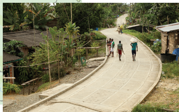
Figura 4. Red Terciaria Campo Hermoso, Buenaventura, Valle del Cauca.