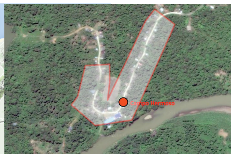
Figura 2. Ubicación del Consejo Comunitario de Campo Hermoso orillas del río Dagua, Valle del Cauca.