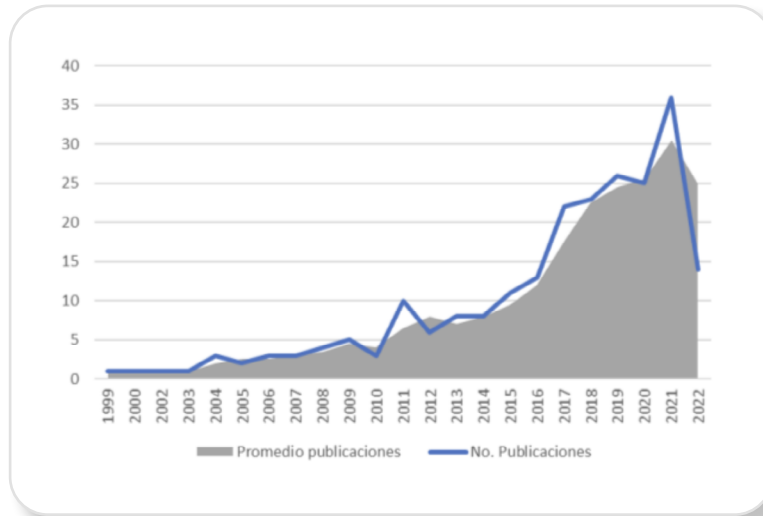
Ilustración 1. Indicador de productividad: número de publicaciones por año.