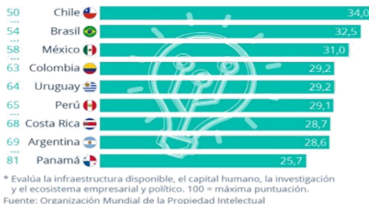
Figura 1. Países innovadores de América Latina 2022