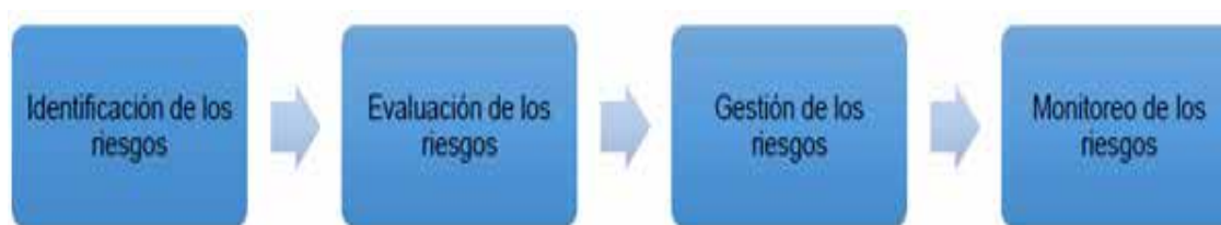
Figura 1. Fases de un sistema de gestión de riesgos para la cadena de suministro

En la Figura 2 se muestra la configuración de la cadena de suministro hortofrutícola, la cual se construyó de acuerdo con la revisión de los trabajos presentados por (Siegel et al. , 2010), (Dani, 2009), (Lang & Ding, 2013), (Rebolledo, 2015), (Yeboah et al. , 2014).