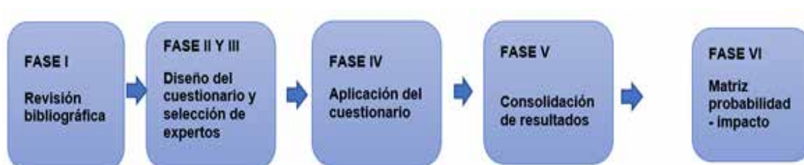
Figura 3. Esquema metodológico propuesta.

Respecto a las exportaciones, durante los últimos cinco años (2010-2015) las exportaciones de este subsector se han incrementado en 24 mil toneladas, a 193 mil toneladas, creciendo a un ritmo de 3,2% anual. Asimismo, en términos de valor las exportaciones de frutas y hortalizas