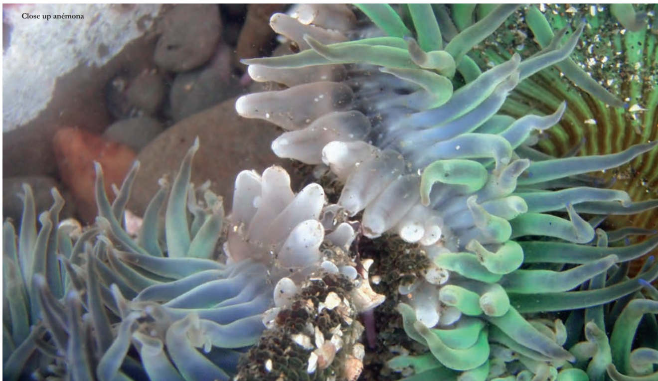
Close up anémona

La Calidad Académica, un Compromiso Institucional