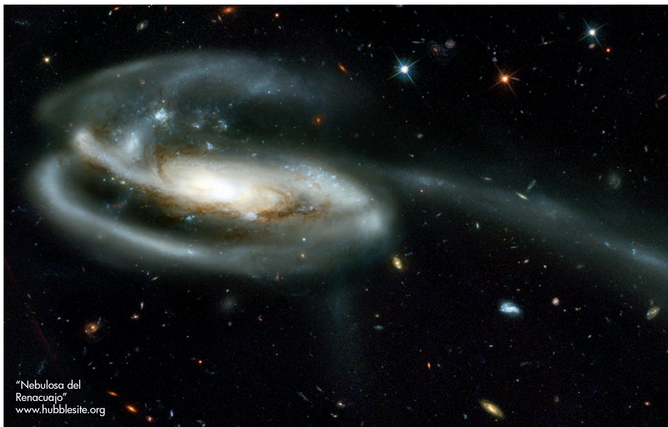
"Nebulosa del Renacuajo" www.hubblesite.org

La Calidad Académica, un Compromiso Institucional