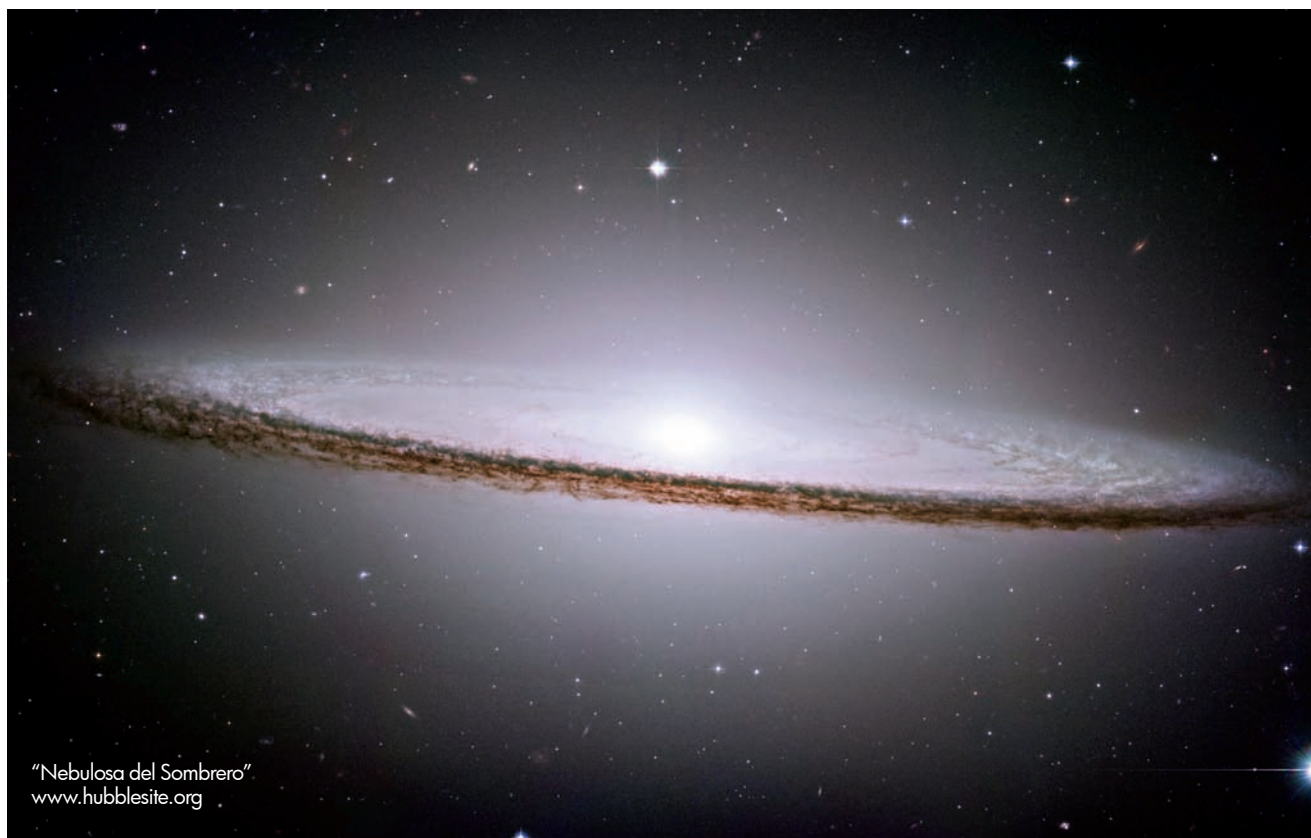
"Nebulosa del Sombrero"

La Calidad Académica, un Compromiso Institucional