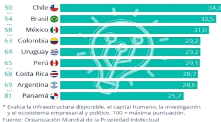
Figura 1. Países innovadores de América Latina 2022