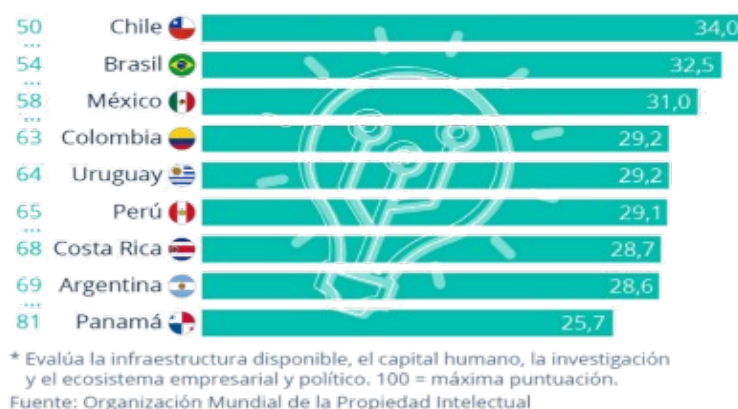
Figura 1. Países innovadores de América Latina 2022