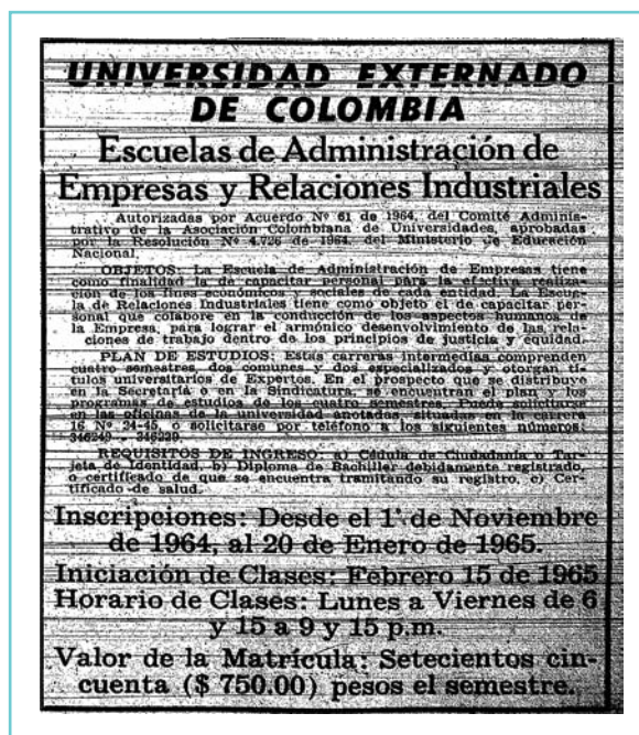
Figura 1. Aviso de prensa de la Universidad Externado de Colombia anunciando la apertura de la Escuela de Administración de Empresas y Relaciones Industriales.

En el Externado de Colombia se inició la oferta de estudios de administración en conocimientos de relaciones industriales antes de obtener autorización del Estado para ofrecer el título profesional de administrador de empresas. Por tanto, en esta Universidad se otorgó con anterioridad el título de “Experto en Relaciones Industriales” y no el de administrador de empresas.