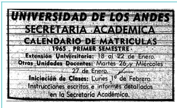
Figura 4. Aviso de prensa de la Universidad de Los Andes al inicio del Calendario Académico de 1965.

dualidad que en últimas condujo a la separación en dos facultades con carreras que empezaron a diferenciarse por el contenido de programas, asignaturas y perfiles.