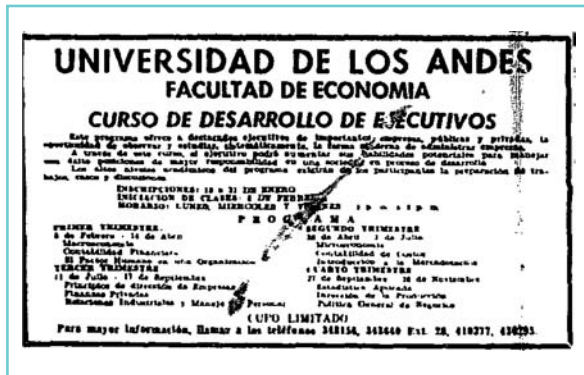
Figura 3. Aviso de prensa de la Universidad de Los Andes promocionando sus “Cursos para Ejecutivos”.