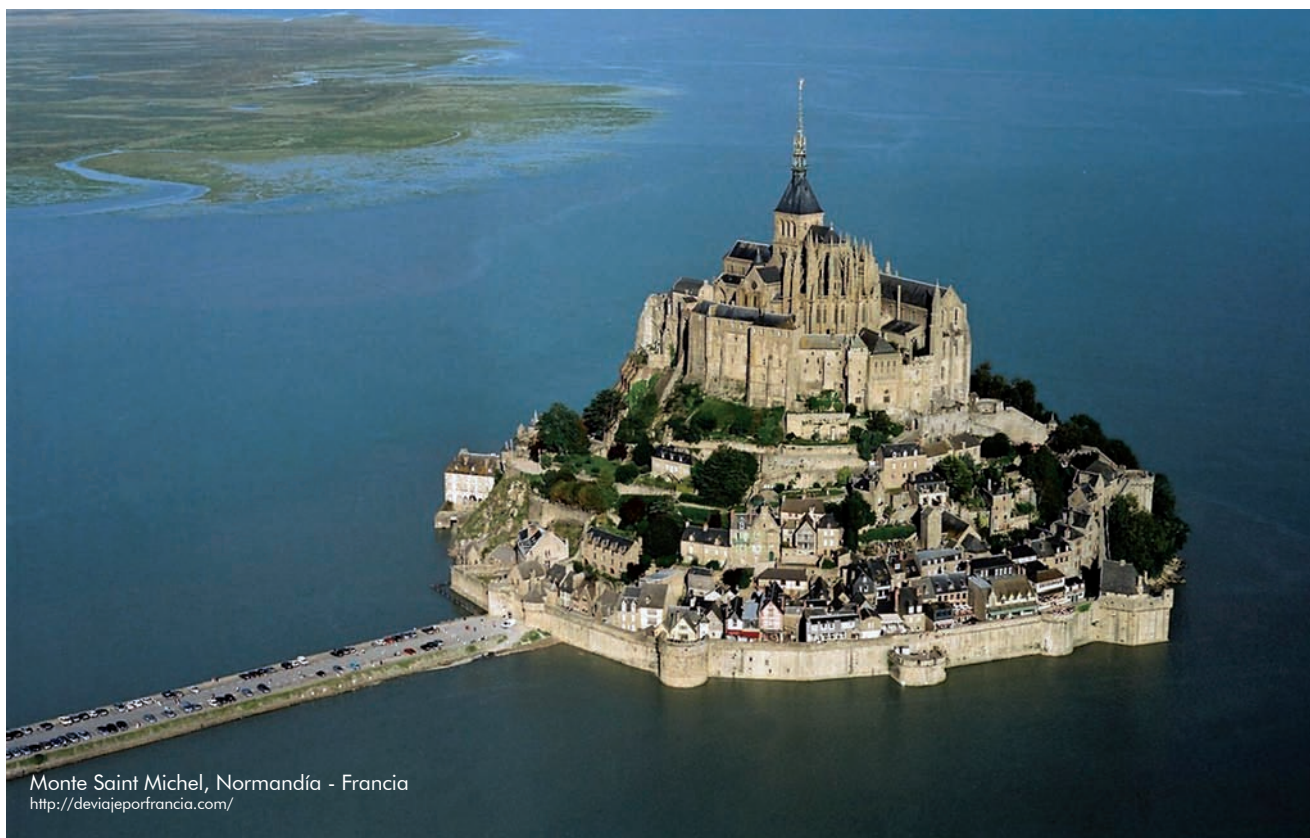
Monte Saint Michel, Normandía - Francia

La Calidad Académica, un Compromiso Institucional