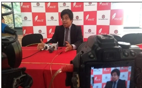
Figura 1. Foto del investigador principal

El objetivo que se planteó fue determinar la aplicabilidad de la LOOT en razón a los principios de flexibilidad y gradualidad en paralelo al actual proceso de pos-conflicto señalando la necesidad de establecer la finalidad constante y no temporal de las "Zonas de paz". La estrategia metodológica utilizada para el desarrollo de la investigación es de carácter socio - jurídico, porque estas tienen un impacto en la sociedad que condiciona el marco jurídico del post-conflicto.